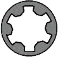
111.590 M 9x1,25x87

Schraubenkopf / Head shape Anziehreihenfolge/Tightening sequence/Ordre de serrage/Orden de apriete Tête de vis / Cabeza de tornillo