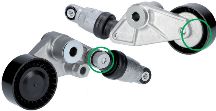
Option B | Variante B | Version B | Variante B | Variante B | Wariant B