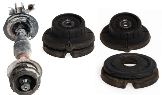
Line up (without spring)