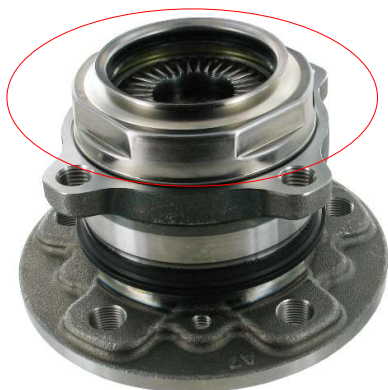
Stary projekt z zaślepką

Zarówno poprzedni, jak i nowy projekt są w pełni zamienne.