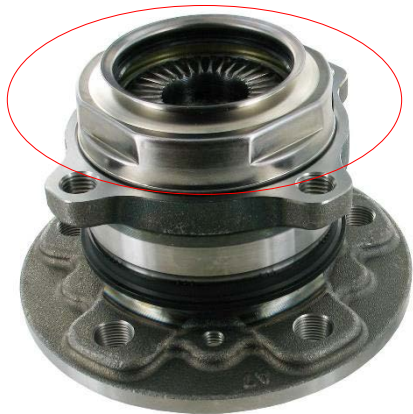
Design anterior com tampa central

Ambos os designs são totalmente permutáveis.