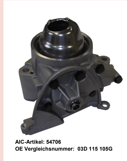
AIC-Artikel: 54706 OE Vergleichsnummer: 03D 115 105G

Kann eine Pumpe den Sog nicht aufbauen, kann sie den Motor auch nicht mit Öl versorgen. Die Folge: der Motor läuft schon im ersten Betrieb trocken. Ein Motorschaden droht.