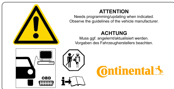
3 - Montage Hinweise / Installation Notes