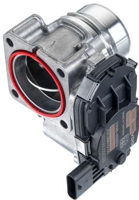
1 - Produkt / Product

Nennspannung (Positionssensor) / Nominal Voltage (Position Sensor) = 5 V