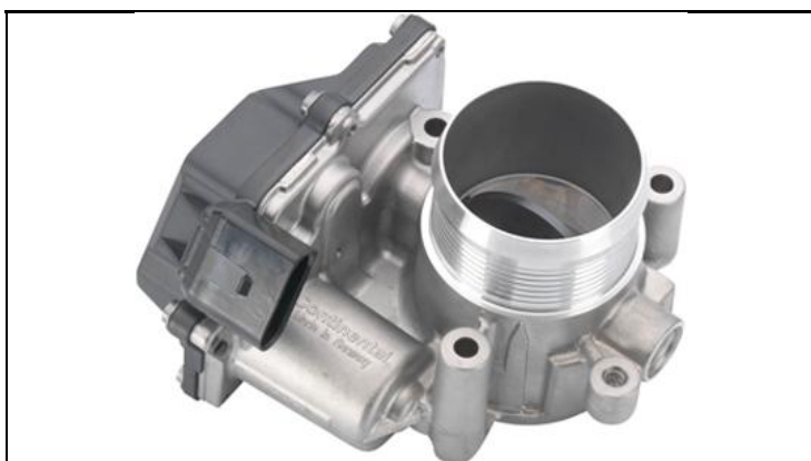
1 - Produkt / Product